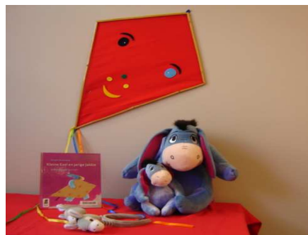
Kleine ezel en jarige Jakkie